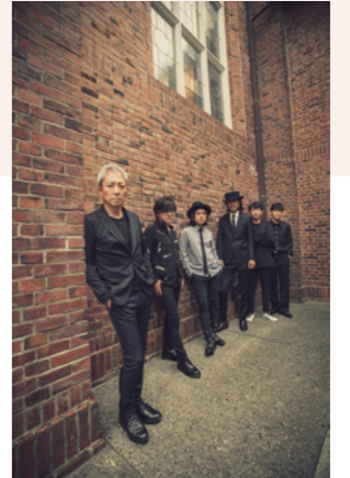
佐野元春 & THE COYOTE BAND

やっぱり音楽って素晴らしいということを感じましたし、それを伝えたいと思いました。今はラジオのレギュラー番組は持っていないのですが、ファンの間では「『元春レディオ・ショー』をやってくれないか」という要望がずっとあって、今回FM COCOLOのスタッフの方がやってみないかと声