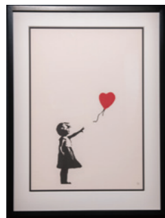
ガール・ウィズ・バルーン

謎に包まれたアーティスト、バンクシー。世界のコレクターから集められた貴重なコレクションや、楽しく彼の多面的な世界を味わえるインスタレーションなど70点以上の作品がついに大阪に初上陸。バンクシーならではのユーモアと愛を、そしてアートのパワーを浴びて来て下さいね！(DJちわきまゆみ)