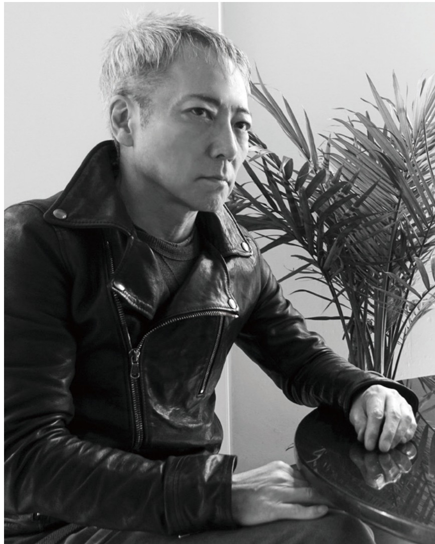
©M's Factory Music Publishers, Inc. 写真を無断で転載、改変、ネット上で公開することを固く禁じます。

「エンターテインメントのその先にある、 “表現”というところにまで行き着きたい」