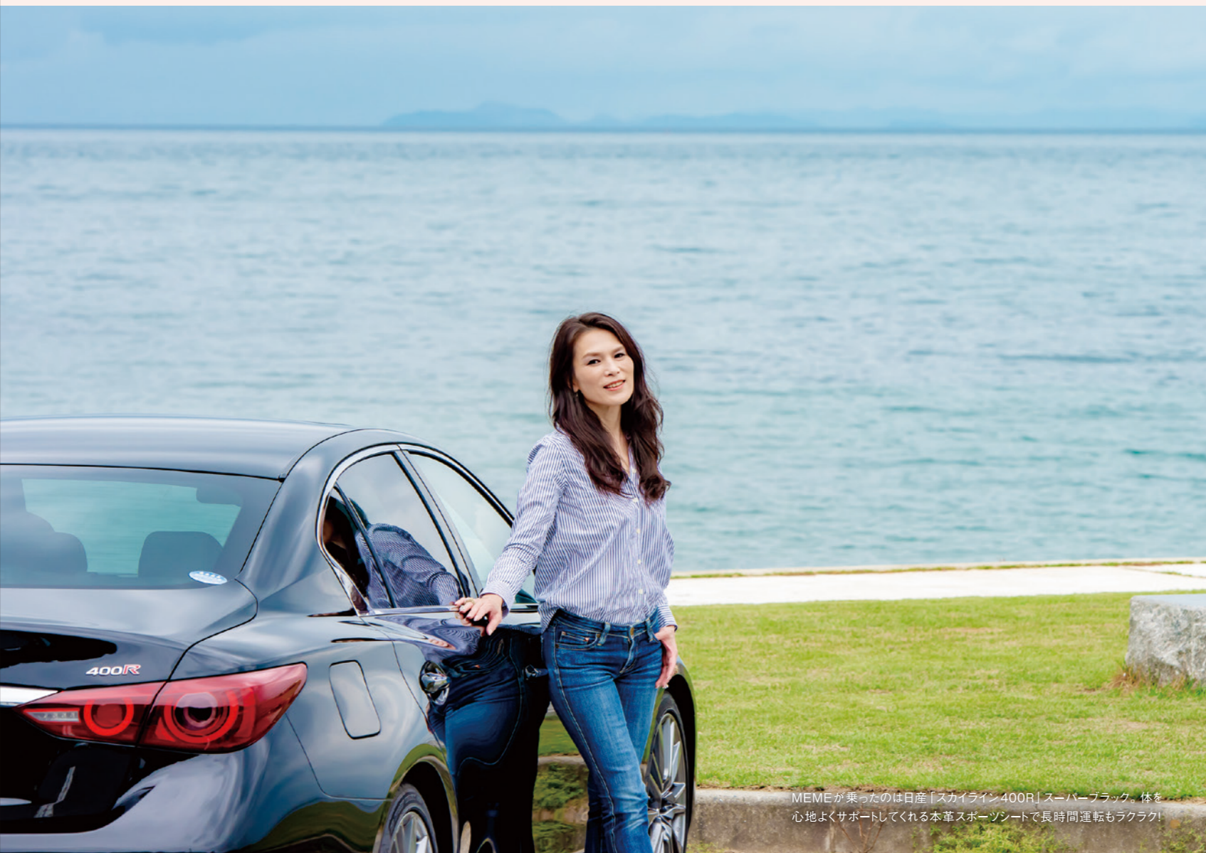
MEMEが乗ったのは日産「スカイライン400R」スーパーブラック。体を心地よくサポートしてくれる本革スポーツシートで長時間運転もラクラク!