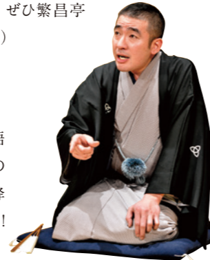
天満天神繁昌亭 URL https://www.hanjotei.jp/

10/4(日)にはFM COCOLO初の落語会も無事開催終了！ 開局25周年を記念して、上方落語を初めて見る方に向けた解説付きの落語会を開催しました。2回目以降の開催も企画予定です。お楽しみに！